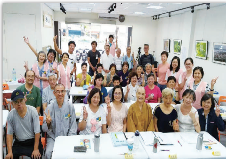
▲ 2019年8月台北高心靈廣場《事事本無礙》二日專修班合影