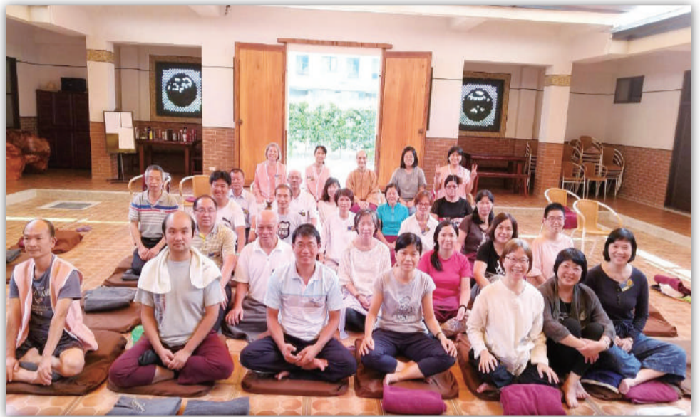
▲ 2019年9月宜蘭礁溪湖山水講堂 道法自然二日山水禪修營合影

(本文摘錄自20180903，吉林歡喜嶺妙解研習 空海(郭永進)老師與學員問答)